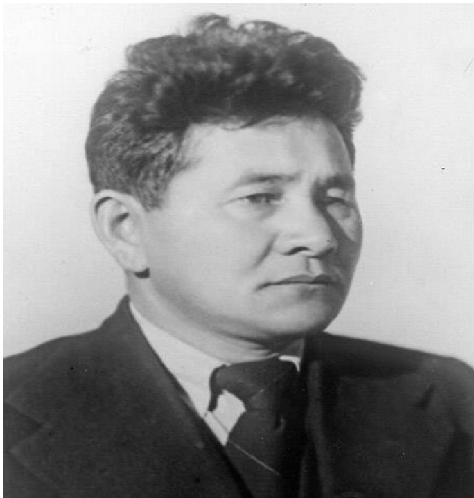
АХМЕТ ҚУАНҰЛЫ ЖҰБАНОВ /1906-1968/